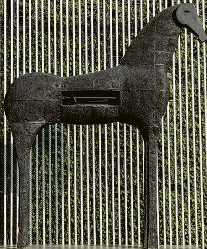
“Il Cavallo” | Opera di Mimmo Paladino nella sede principale FLORIM (Fiorano Modenese - MO - Italia)