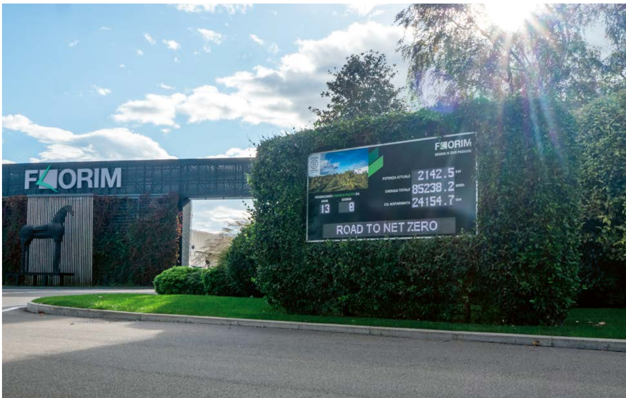
Ingresso sede principale FLORIM (Fiorano Modenese - MO)