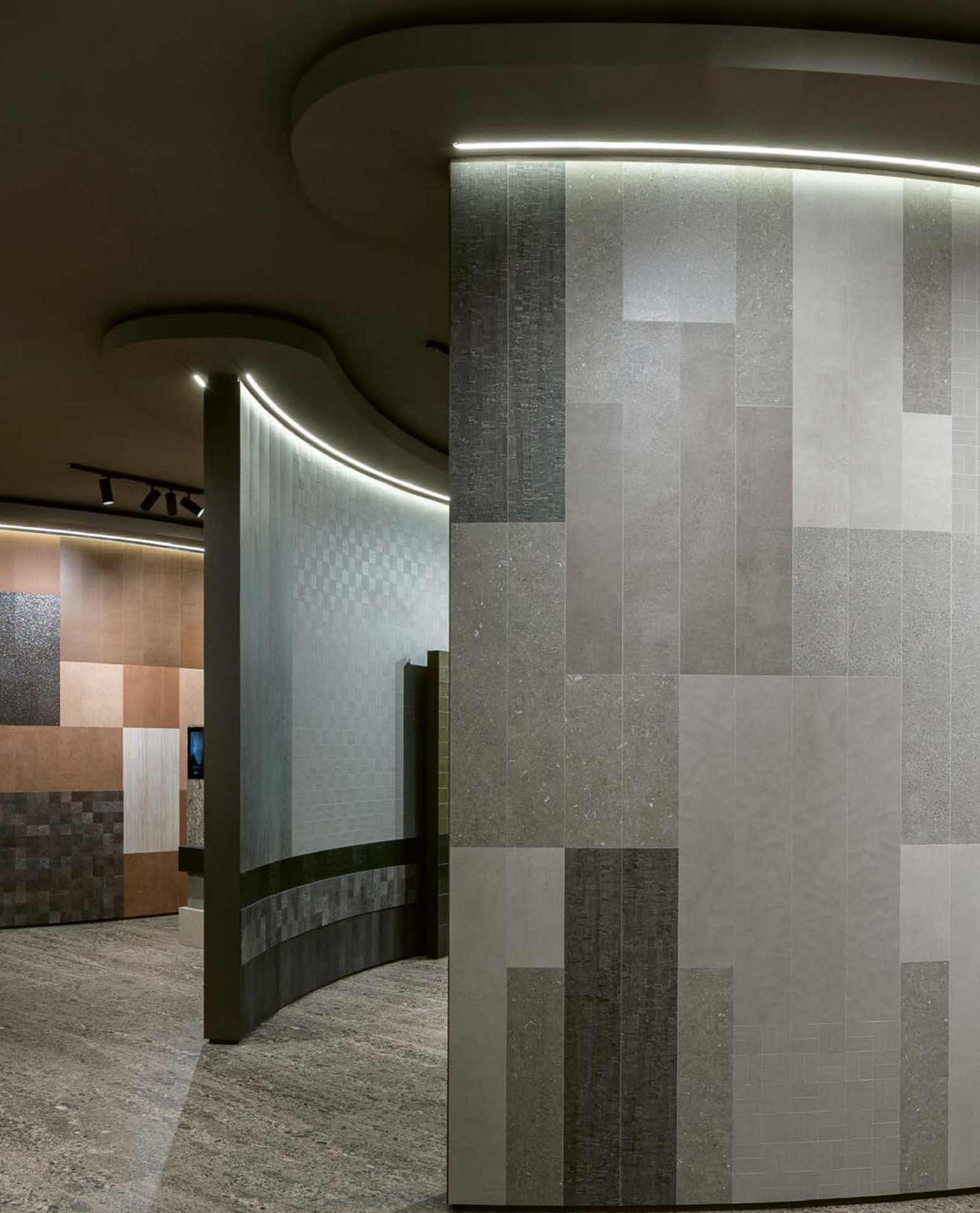
Installazione FLORIM | PIAZZA CASTELLO Milano gentile disegnato da Matteo Thun e Nicola Gallizia Milano Design Week 2026